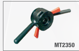
GTR -> 802443938 Ghiera rapida fissaggio ruote Quick ring nut for securing wheel