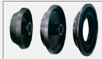
KCT -> 802245159 Gruppo coni centraggio ruote da autocarri Set of cones for truck wheel centering

Per maggiori informazioni consultare il catalogo accessori completo For further information, consult the complete accessories catalogue