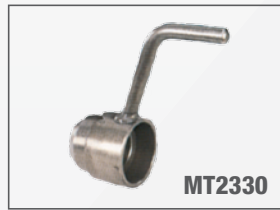
GTM -> 802245933 Ghiera fissaggio ruote Ring nut for securing wheel