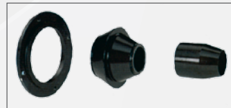
ARU -> 802247782 Accessorio base di centraggio per ruote auto Basic centering accessory for car wheel